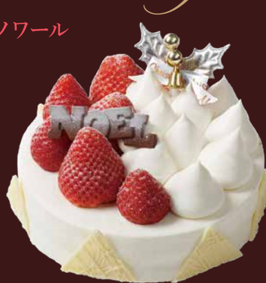
Noël fraise blanc ノエルフリーズブラン

いちご王国栃木のブランドいちご“ベリー大きい”“ベリーきれい”“ベリーおいしい”「スカイベリー」(栃木県鹿沼市「ベリーズファン」)と宮城県山元町のいちご「にこにこベリー」、2種のいちごを贅沢にデコレーションしました。ふわふわスポンジと上品な甘さのクリーム、甘酸っぱいいちごをお楽しみいただけるノエルフリーズブラン、ショコラクリーム、ショコラスポンジとショコラの豊かな味わいと華やかないちごの味わいをご堪能いただけるノエルフリーズノワール、2種のクリスマスケーキをご用意しました。